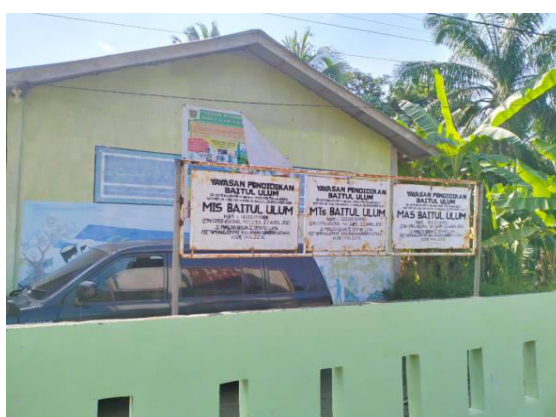
Gambar 1. Madrasah Baitul Ulum Desa Sei Lama

Quizizz adalah sebuah platform pembelajaran berbasis game yang populer di sektor teknologi pendidikan. Platform ini membantu guru mengintegrasikan instruksi, diskusi, dan evaluasi ke dalam satu platform yang dapat diakses secara gratis oleh semua guru di seluruh dunia. Penggunaan Quizizz tidak terbatas oleh waktu dan ruang karena memiliki pengaturan waktu yang fleksibel. Siswa hanya perlu memasukkan kata sandi atau gamepin untuk memulai kuis tanpa harus berada di tempat yang sama dengan guru atau teman-temannya. Selain itu, Quizizz juga menyediakan fitur evaluasi real-time yang memungkinkan guru memberikan umpan balik langsung dan membantu siswa meningkatkan pemahaman mereka. Oleh karena itu, teknologi pendidikan seperti Quizizz memberikan banyak manfaat dalam proses pembelajaran, membuatnya lebih menarik dan efektif.