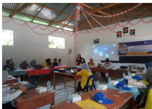
Gambar 2. Pelaksanaan Kegiatan Workshop

Dari pelaksanaan pengabdian ini didapatkan bahwa sebelum dilaksanakannya kegiatan pengabdian diperoleh informasi bahwa rata-rata guru tidak dan belum pernah menggunakan Quizizz sebagai media pembelajaran. Tetapi setelah pelaksanaan pengabdian ini guru mampu memahami penggunaan Quizizz sebagai media pembelajaran sehingga dapat dipastikan peserta pelatihan dapat mengimplementasikan salah satu jenis assesment berbasis aplikasi web. Dari kegiatan pengabdian yang dilaksanakan di Madrasah Baitul Ulum diperoleh hasil yang cukup signifikan. Tenaga pendidik yang berjumlah 19 orang, 11 diantaranya sudah mahir menggunakan aplikasi Quizizz. Dapat dilihat pada diagram berikut;