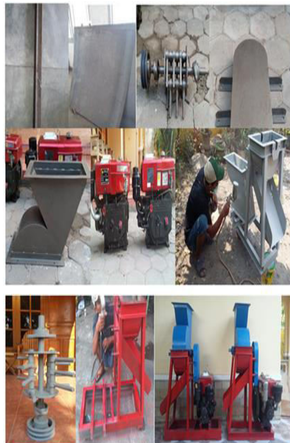
Gambar 6 Gambar proses pembuatan mesin penghancur kotoran sapi.

dengan menggunakan pully dan belt. Pemilihan penggerak dan sumber energi yang digunakan sangat penting, karena berpengaruh terhadap cara pengoperasionalannya dan perawatan yang harus dilakukan agar mesin tersebut bisa berfungsi maksimal dan umur mesin menjadi lebih lama