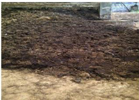
Gambar 5 Kotoran sapi yang dikeringkan siap untuk di hancurkan