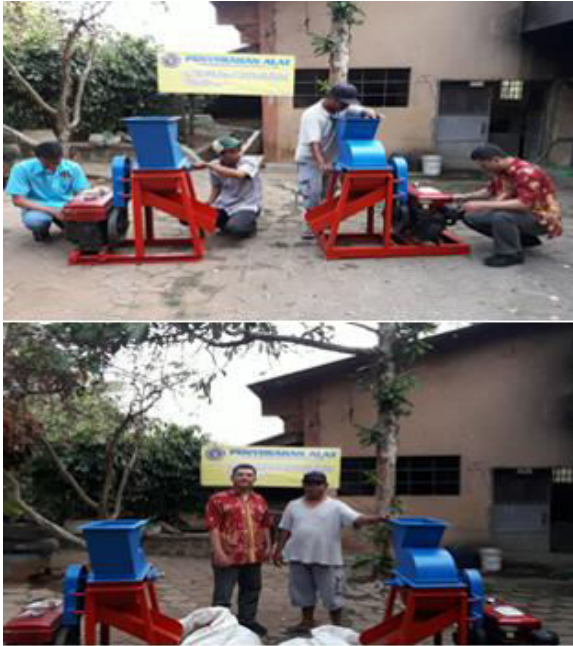
Gambar 7 Pelatihan dan penyerahan mesin pengaduk.

Sebelum diberikan ke UKM mitra mesin diuji coba dahulu, setelah semua dirasa berjalan normal sesuai dengan perencanaan maka dilanjutkan dengan pelatihan mengoperasikan mesin kepada UKM yang akan menggunakan.