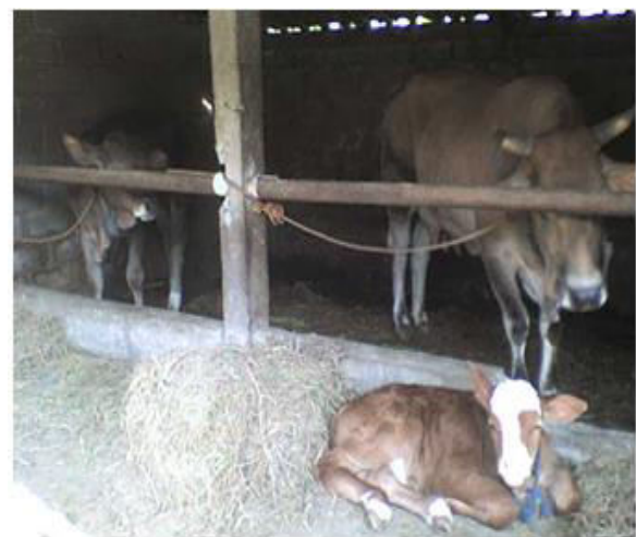
Gambar 2 Kondisi peternakan mitra UKM 2