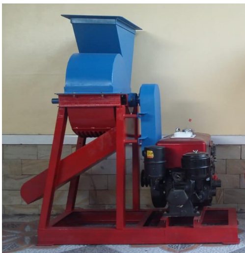
Gambar 8 Mesin pengaduk kotoran sapi dan arang sekam

Sebelum diberikan ke UKM mitra mesin diuji coba dahulu, setelah semua dirasa berjalan normal sesuai dengan perencanaan maka dilanjutkan dengan pelatihan mengoperasikan mesin kepada UKM yang akan menggunakan.