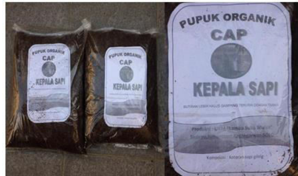
Gambar 9. Produk UKM pupuk dalam kemasan.

c. Proses Produksi pupuk dan pengemasan.