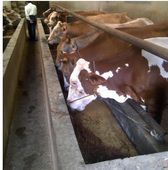
Gambar 1 Kondisi peternakan mitra UKM 1

Pembuatan pupuk kandang ini memang belum menjadi usaha utama dalam peternakan ini, tetapi dengan dilakukannya penggunaan alat untuk mengolah pupuk kandang dengan menggunakan mesin akan membantu proses pembuatan pupuk menjadi lebih cepat. Dengan demikian akan menghasilkan lebih banyak pupuk kandang yang gilirannya akan meningkatkan tambahan hasil penjualan pupuk kandang yang akan mengurangi biaya operasional sehingga keuntungan peternakan ini meningkat.